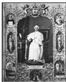
Papież Leon XIII

*) Pewna pobożna osoba, którą Najświętsza Maryja Panna darzyła swymi łaskami miała w roku 1853 widzenie i ujrzała szatanów rozproszonych po całej ziemi i czyniących na niej niewypowiedziane spustoszenia. Równocześnie wzniosła serce i myśli do Najświętszej Maryi Panny i usłyszała od Niej, że czas najwyższy wzywać Królową Aniołów, by posłała na ziemię Zastępy Niebieskie. "Matko Moja - zawołała owa osoba - Ty, która jesteś tak dobrą, czyżbyś nie mogła uczynić tego bez naszej prośby? Nie - odrzekła Najświętsza Panna - bowiem warunkiem postanowionym przez Samego Boga dla otrzymania łask jest modlitwa. Naucz mnie zatem, Matko Moja, jak mamy Cię prosić? - zawołała owa pobożna dusza i w tej samej chwili zdało się jej jakoby Najświętsza Panna nauczyła ją modlitwy "Potężna Niebios Królowo". Ta modlitwa rozszerzyła się bardzo prędko, uzyskała aprobatę wielu biskupów i arcybiskupów a Ojciec Św. Pius X reskrytem z 8. 07. 1908 r. nadał 300 dni odpustu dla tych, którzy ją pobożnie odmówią.