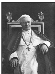
Papież Św. Pius X

Piękny ten herb ukazuje Św. Michała Archanioła trzymającego Krzyż w ręku którym zwycięża szatana