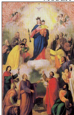
(Obraz Wspomożycielki Wiernych w Turynie we Włoszech)