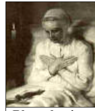
Błogosławiona A.K. Emmerich