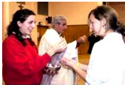
fot. Szafarka udziela Komunii Świętej !!!

Drogi i kochany Jezu, jak długo będziesz krzyżowany na ludzkich rękach, jak długo będziesz poniewierany. Jesteś Panem Wszechświata, przyjdź i pociesz nas, bo już większej zniewagi nie dokona nikt, tylko człowiek obecnego czasu.