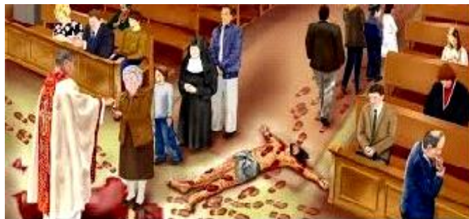
Profanum: Komunia Święta bez pateny i na rękę