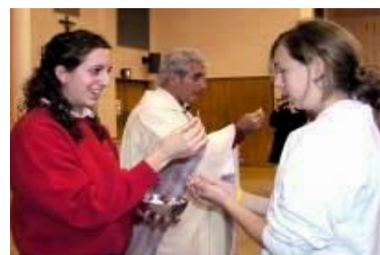
fot. Szafarka udziela Komunii Św. !!!

Drogi i kochany Jezu, jak długo będziesz krzyżowany na ludzkich rękach, jak długo będziesz poniewierany. Jesteś Panem Wszechświata, przyjdź i pociesz nas, bo już większej zniewagi nie dokona nikt, tylko człowiek obecnego czasu.