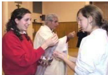
fot. Szafarka udziela Komunii Św !!!

Drogi i kochany Jezu, jak długo będziesz krzyżowany na ludzkich rękach, jak długo będziesz poniewierany. Jesteś Panem Wszechświata, przyjdź i pociesz nas, bo już większej zniewagi nie dokona nikt, tylko człowiek obecnego czasu.