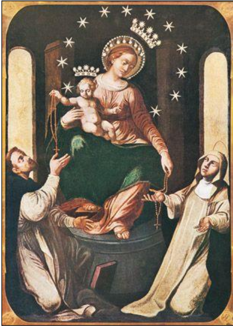
Cudowny obraz Matki Bożej Różańcowej z Pompei.

O błogosławiony Różańcu Maryi, słodki łańcuchu, który łączysz nas z Bogiem! O więzi miłości, która nas jednoczysz z Aniołami! O wieżo ocalenia od napaści piekła; bezpieczny porcie w morskiej katastrofie! Nigdy cię nie porzucimy! Będziesz nam pociechą w godzinie konania. Tobie ostatni pocałunek gasnącego życia. A ostatnim akcentem naszych warg będzie Twoje słodkie Imię, o Maryjo, o Królowo Różańca z Pompejów, o Matko nasza droga, o Ucieczko grzeszników, o Władczyni, Pocieszycielko strapionych! Bądź wszędzie błogosławiona, dziś i zawsze, na ziemi i w Niebie!. Słowa papieża Jana Pawła II z Listu apostolskiego "Rosarium Virginis Mariae"