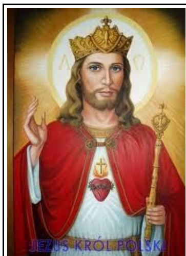
JEZUS CHRYSYTA KRÓL POLSKI I WSZECHŚWIATA